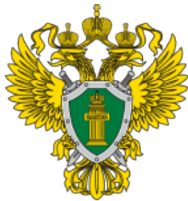
Прокуратура Рязанской области