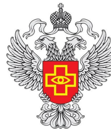
Территориальный орган Управления Федеральной службы по надзору в сфере здравоохранения по Рязанской области