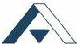
Центральное окружное отделение Арбитражного центра при РСПП