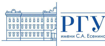
Федеральное государственное бюджетное образовательное учреждение высшего образования «Рязанский государственный университет имени С.А. Есенина»