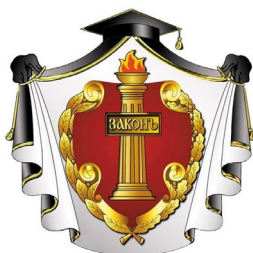
Адвокатская палата Рязанской области