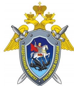
Следственное управление Следственного комитета Российской Федерации по Рязанской области